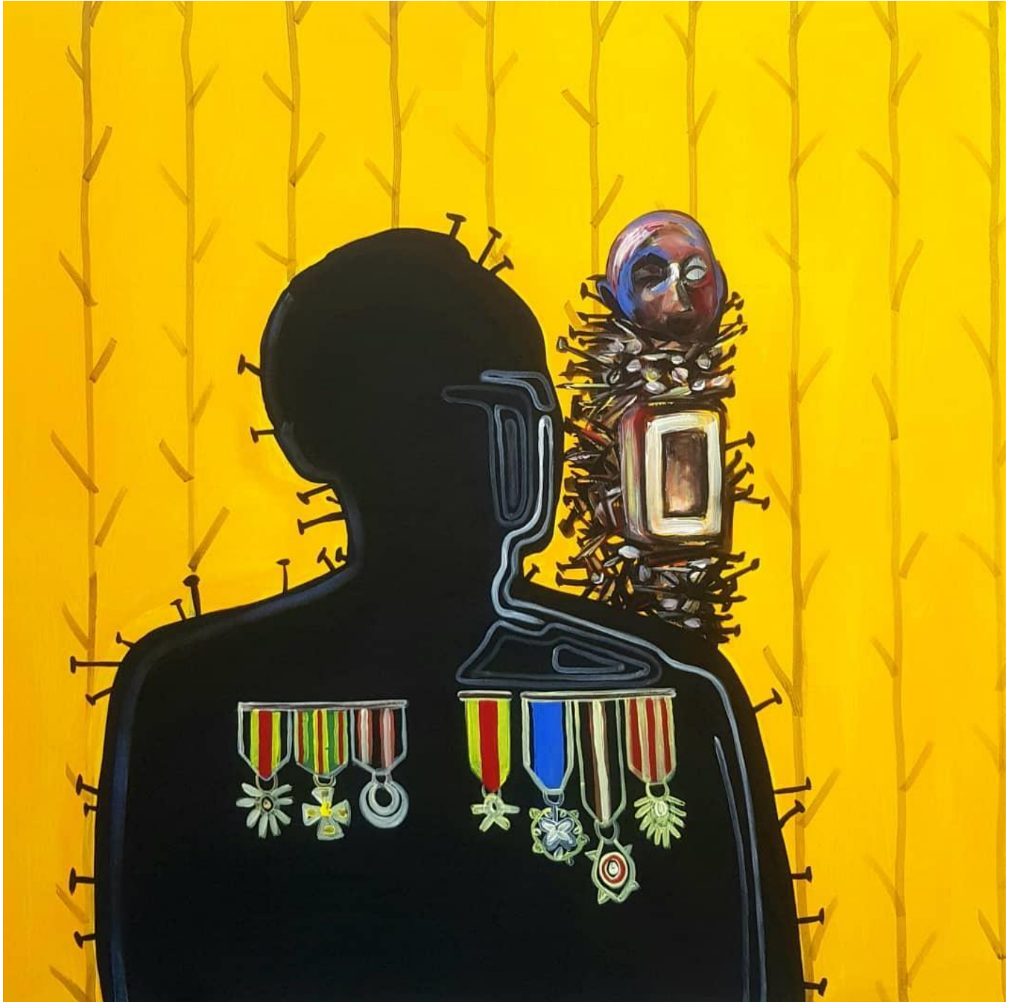
Héros dans l'ombre 100 x 100 cm Acrylique 2022