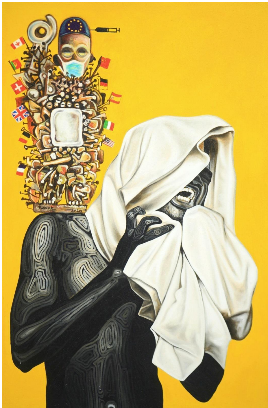
Au secours 150 X 100 cm Acrylique 2020