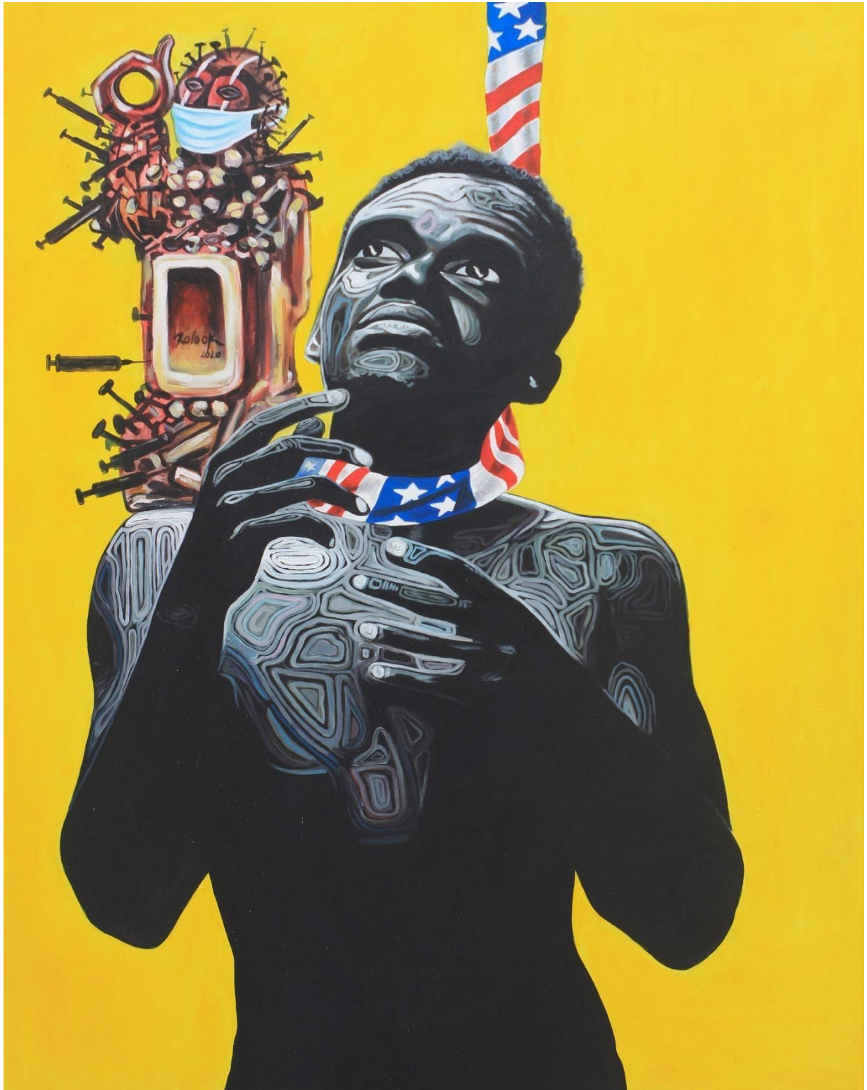
I can't breathe 90 X 120 cm Acrylique 2020