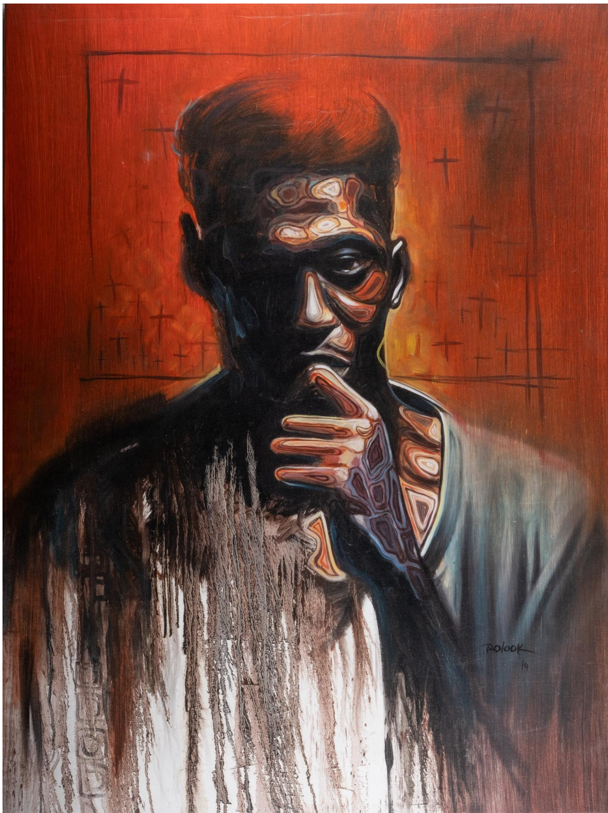
ETUMBU 90X120cm Technique mixte 2019