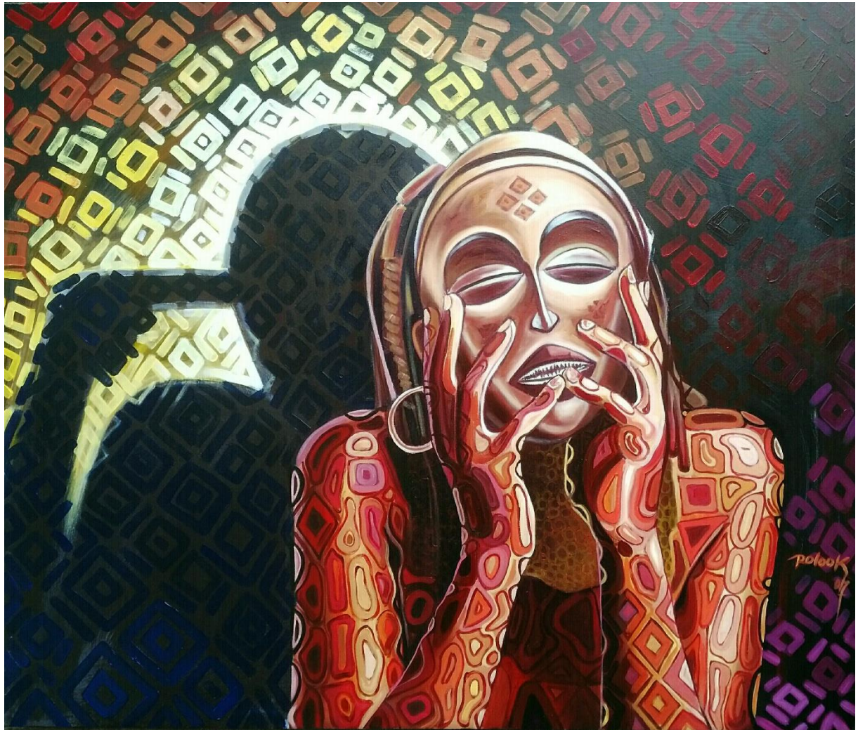
Ignorance 120X100cm Technique mixte