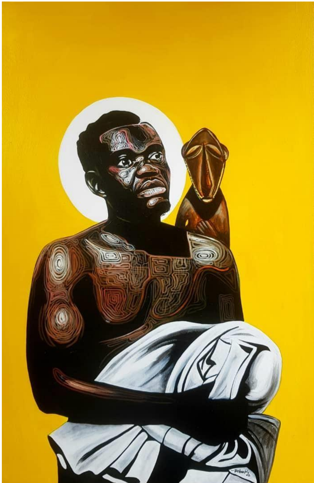
La vie d'ici et d'ailleurs 150 X100 cm Acrylique 2021