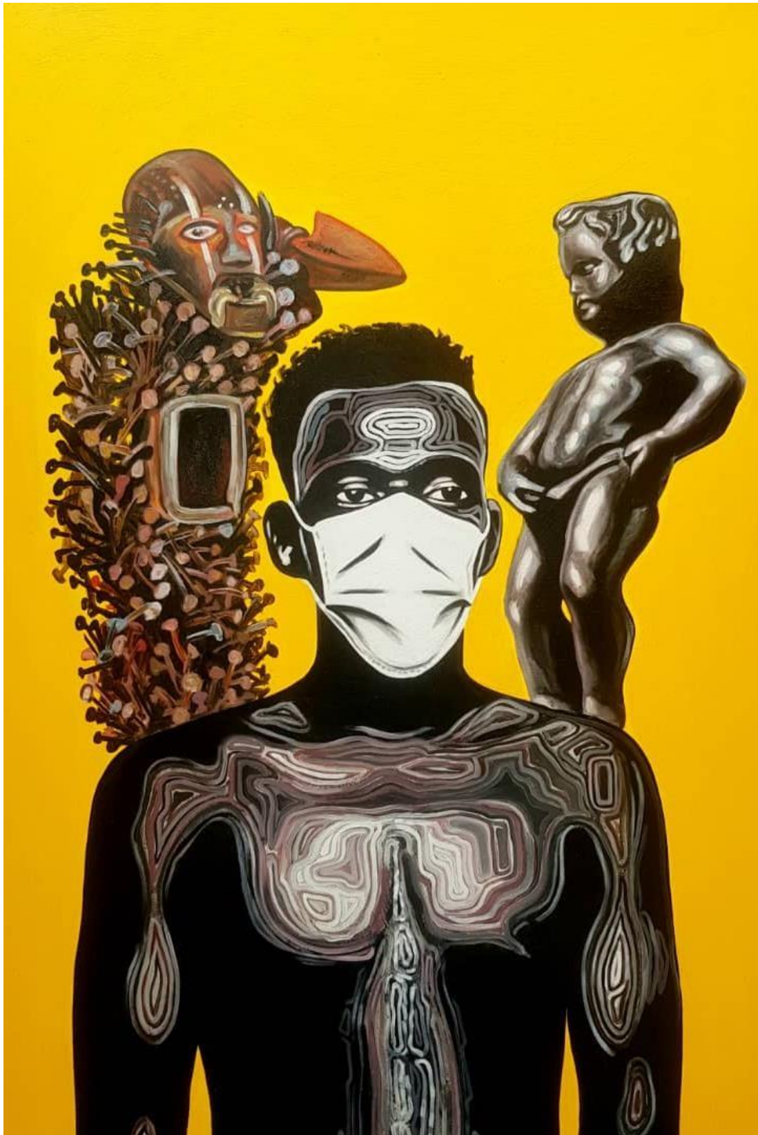
Victime covid-19 150 X 100 cm Acrylique 2021