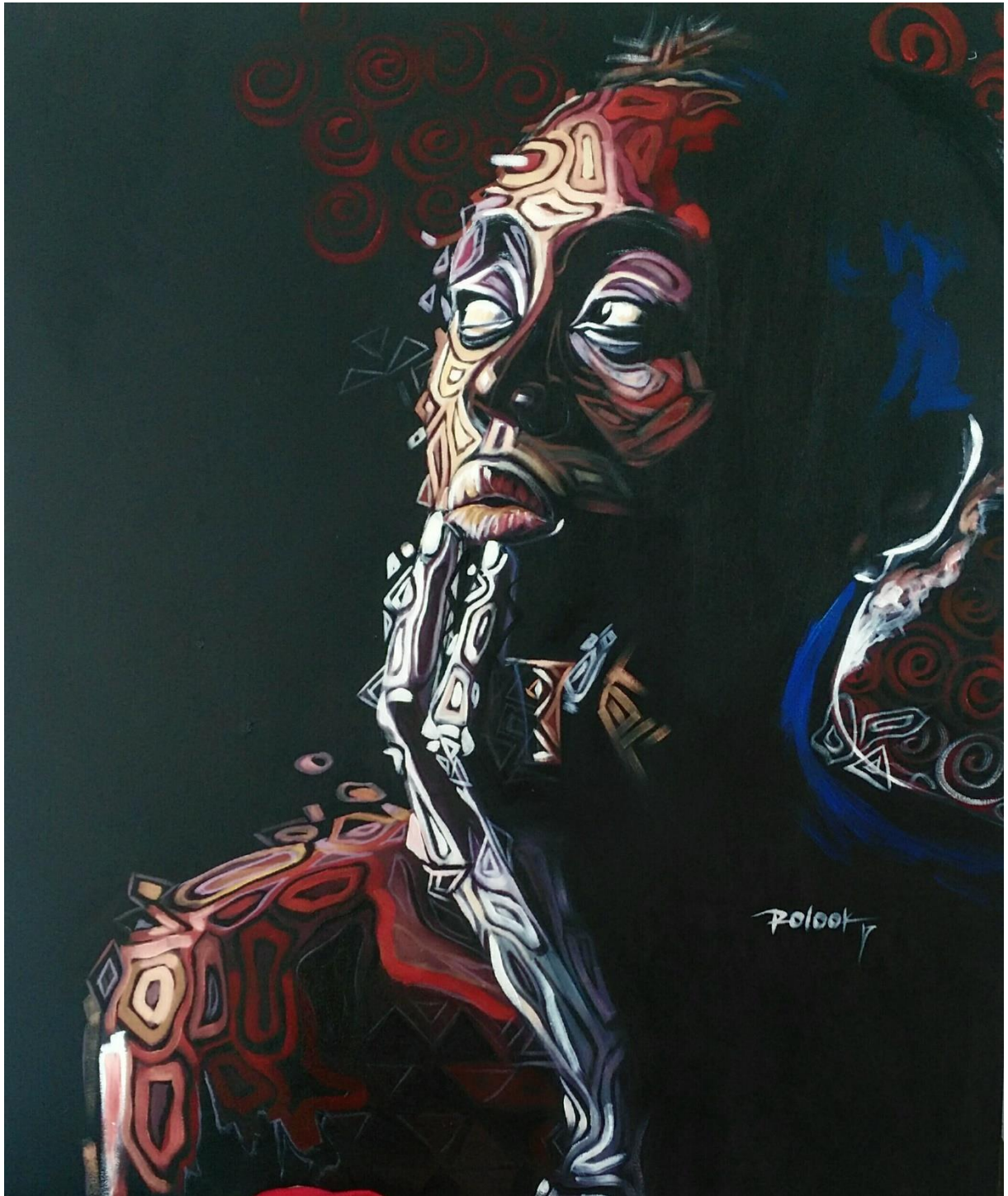
La penseuse 90X120 cm Technique mixte 2017