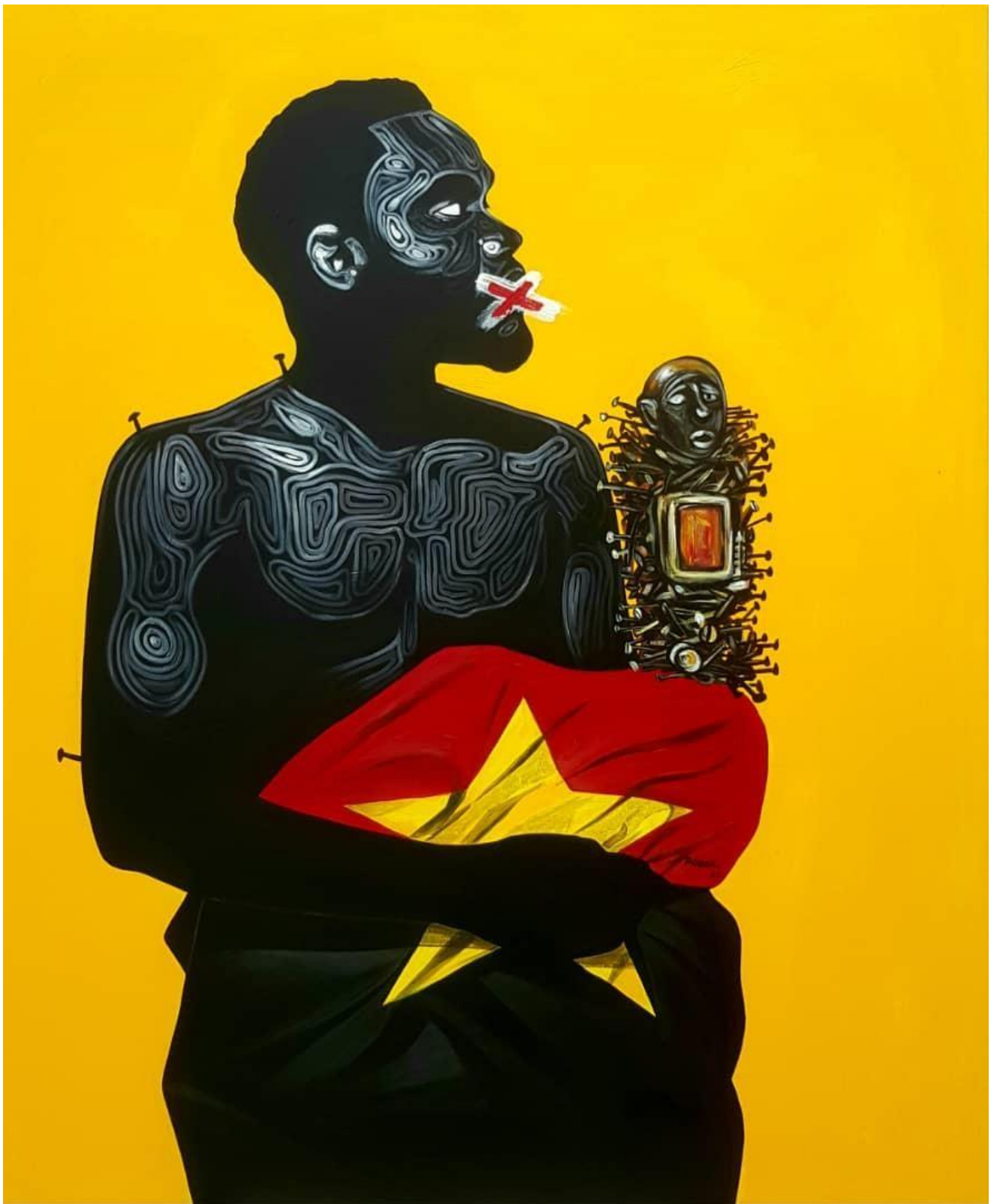
Sans titre 160 X 130 cm Acrylique 2022