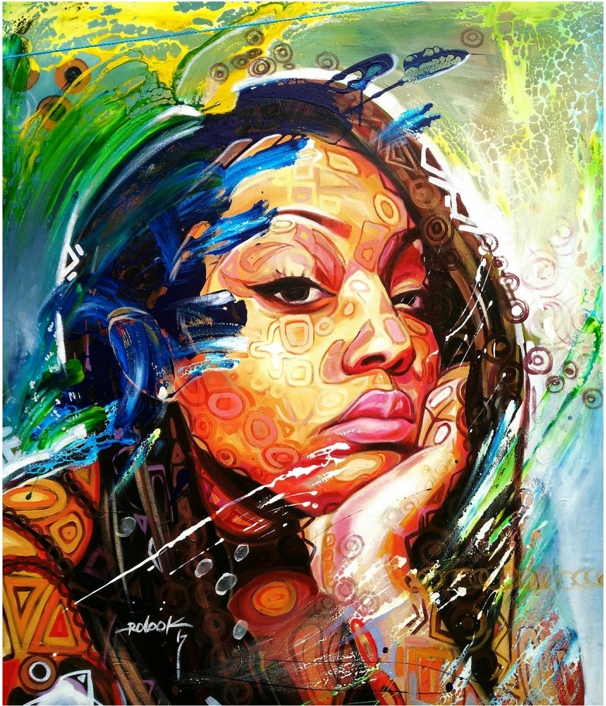
Le regard 90X100cm Technique mixte 2017