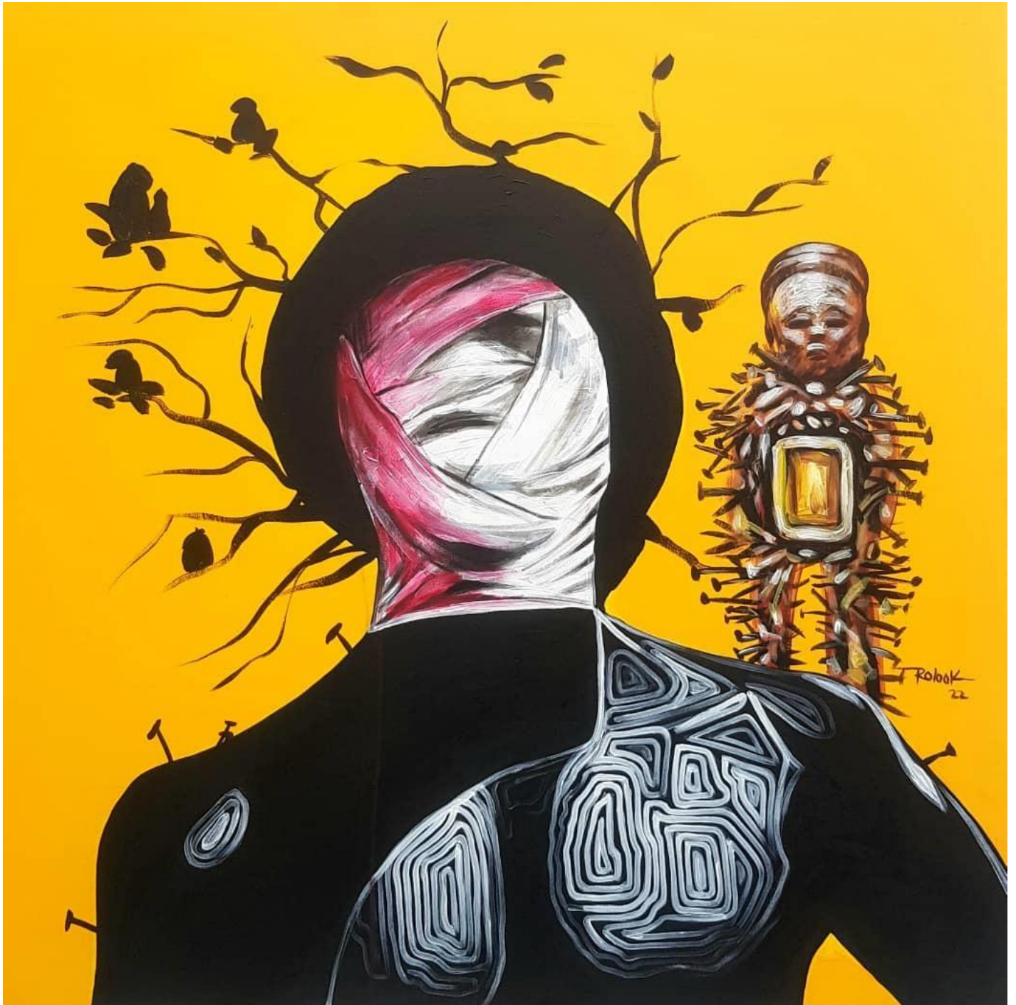
La résilience 100 x 100 cm Acrylique 2022