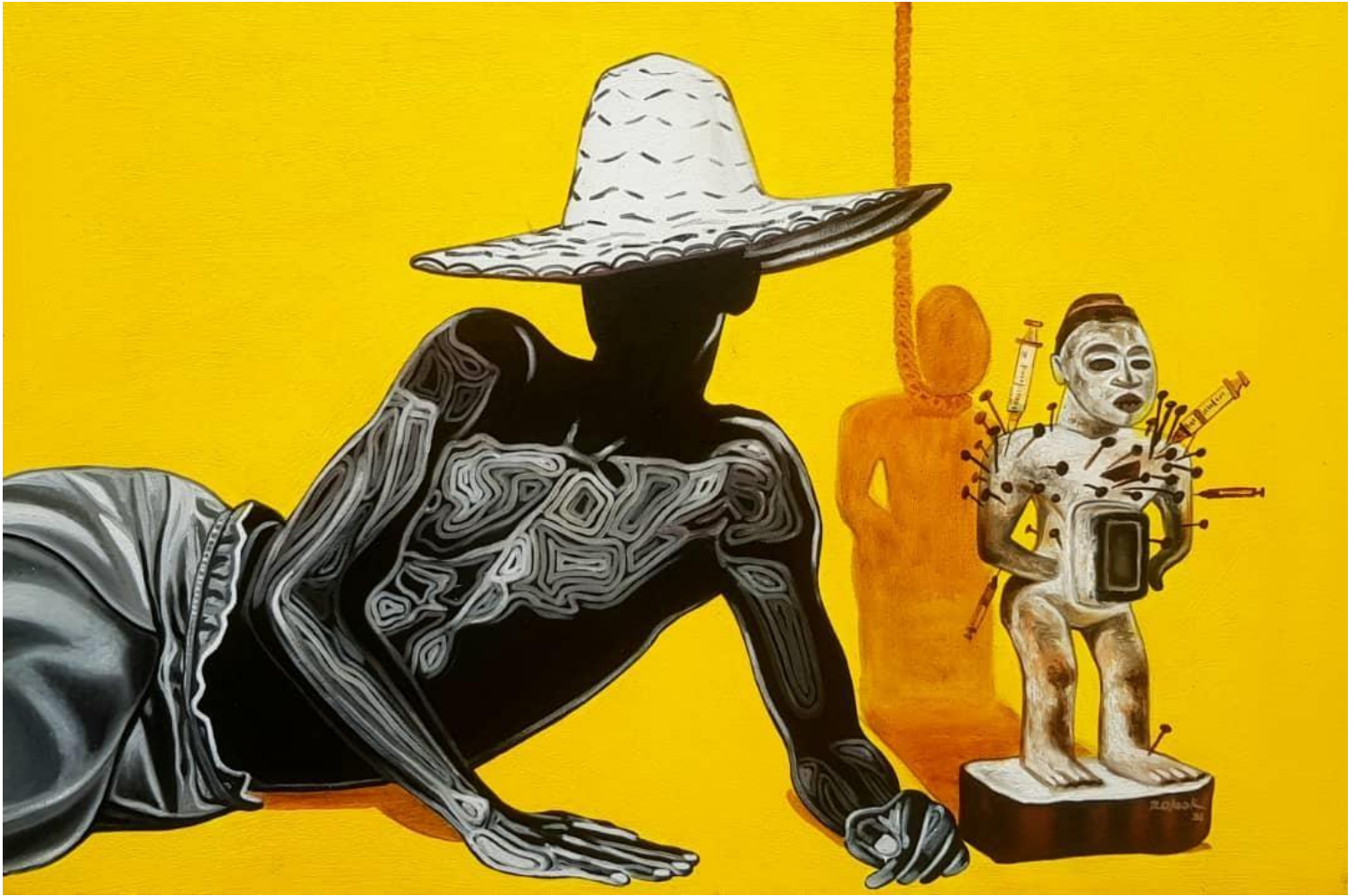
La détente 150 X 100 cm Acrylique 2021