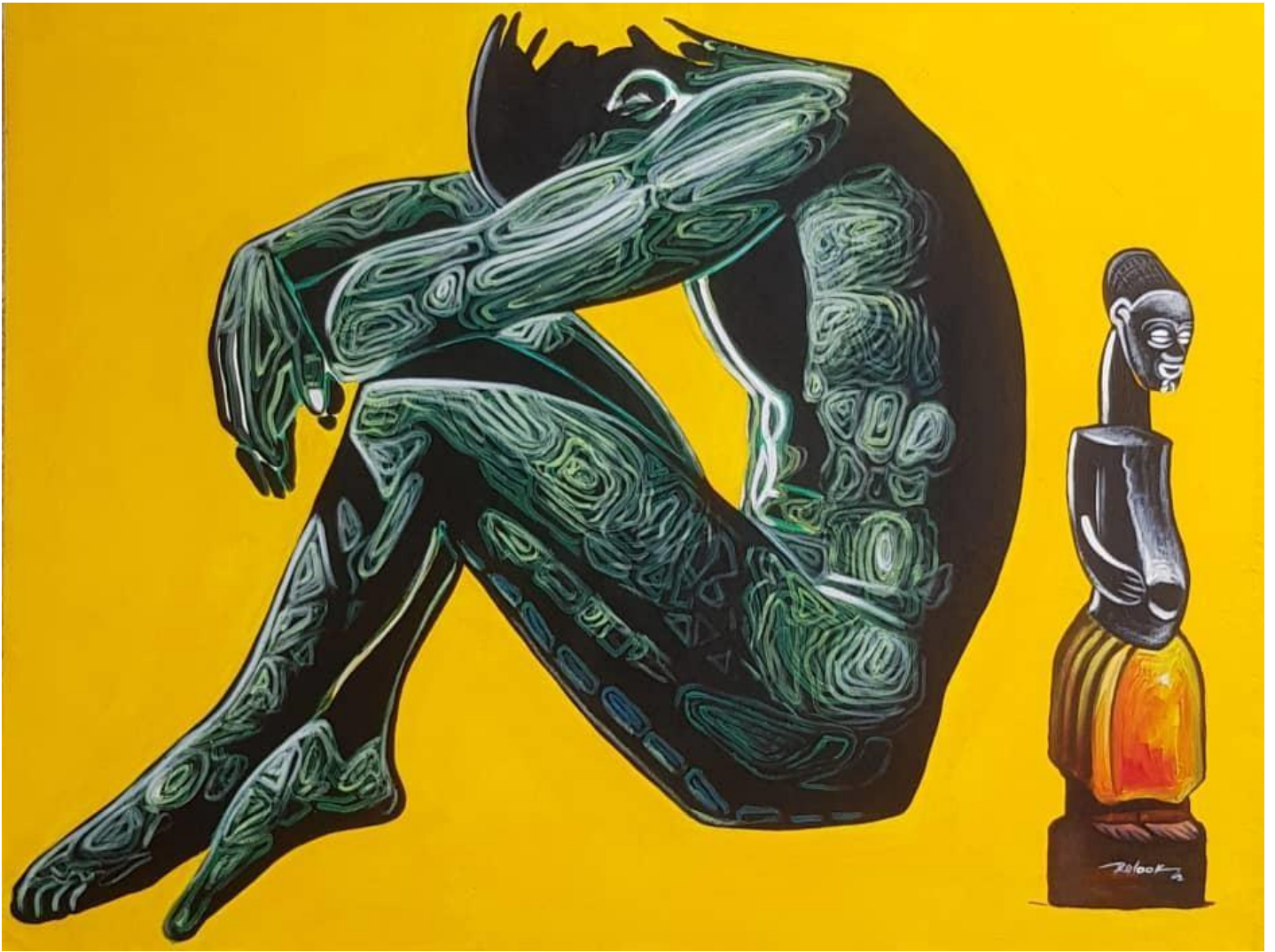
Solitude 120 X 90 cm Acrylique 2021