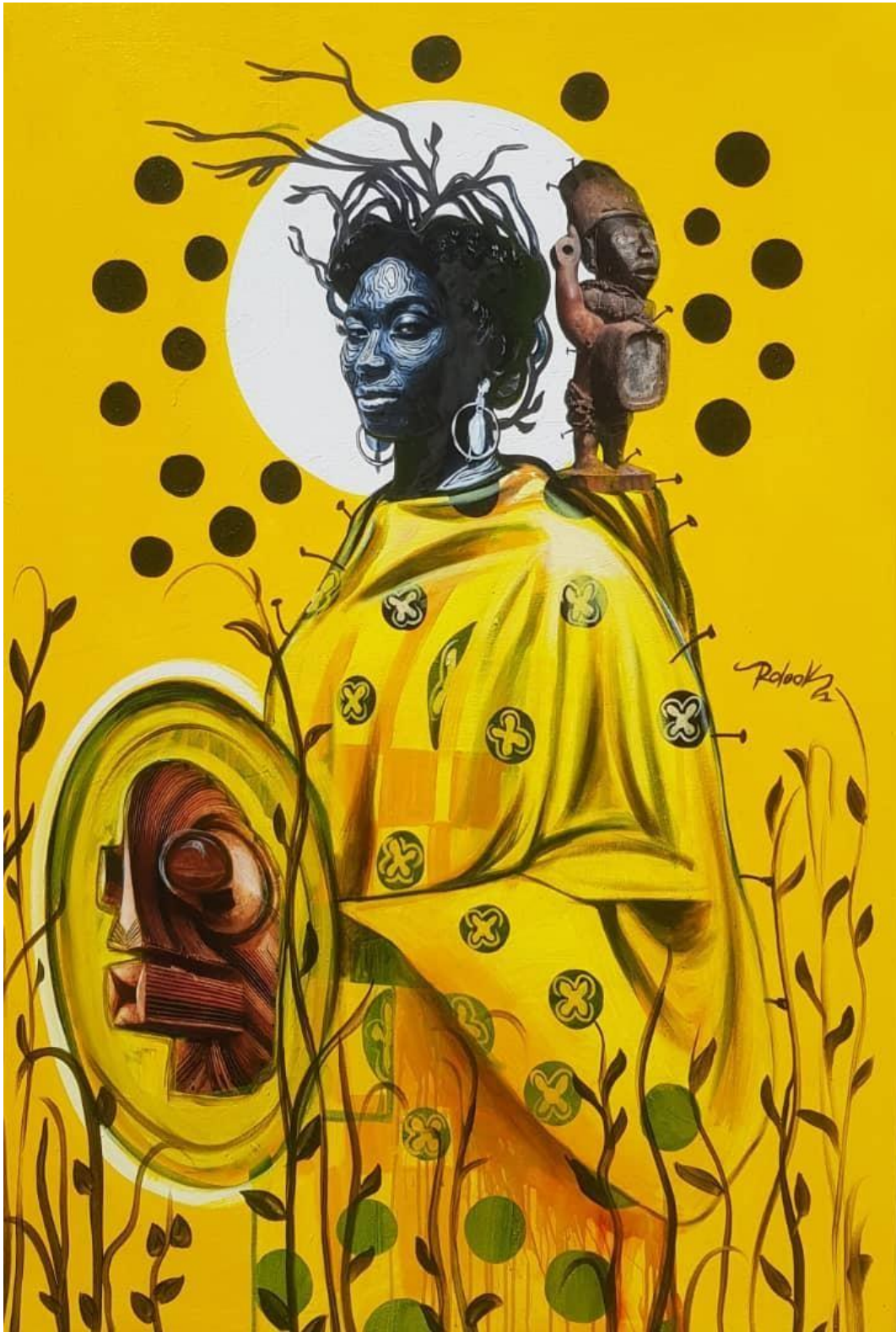
La sentinelle 150 x 100 cm Acrylique 2021