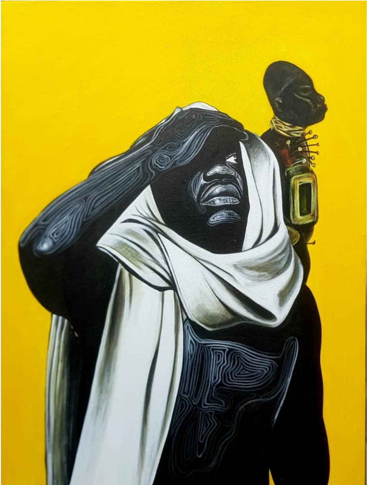
Vision lointaine 90 X 120 cm Acrylique 2020