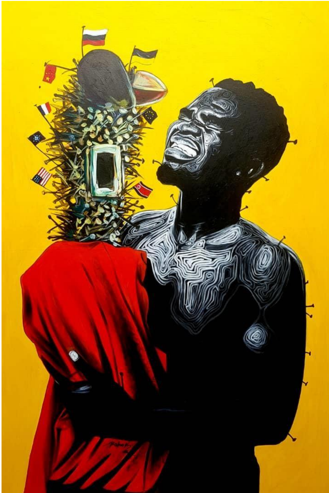
AU SECOURS 150 X 100cm Acrylique 2022