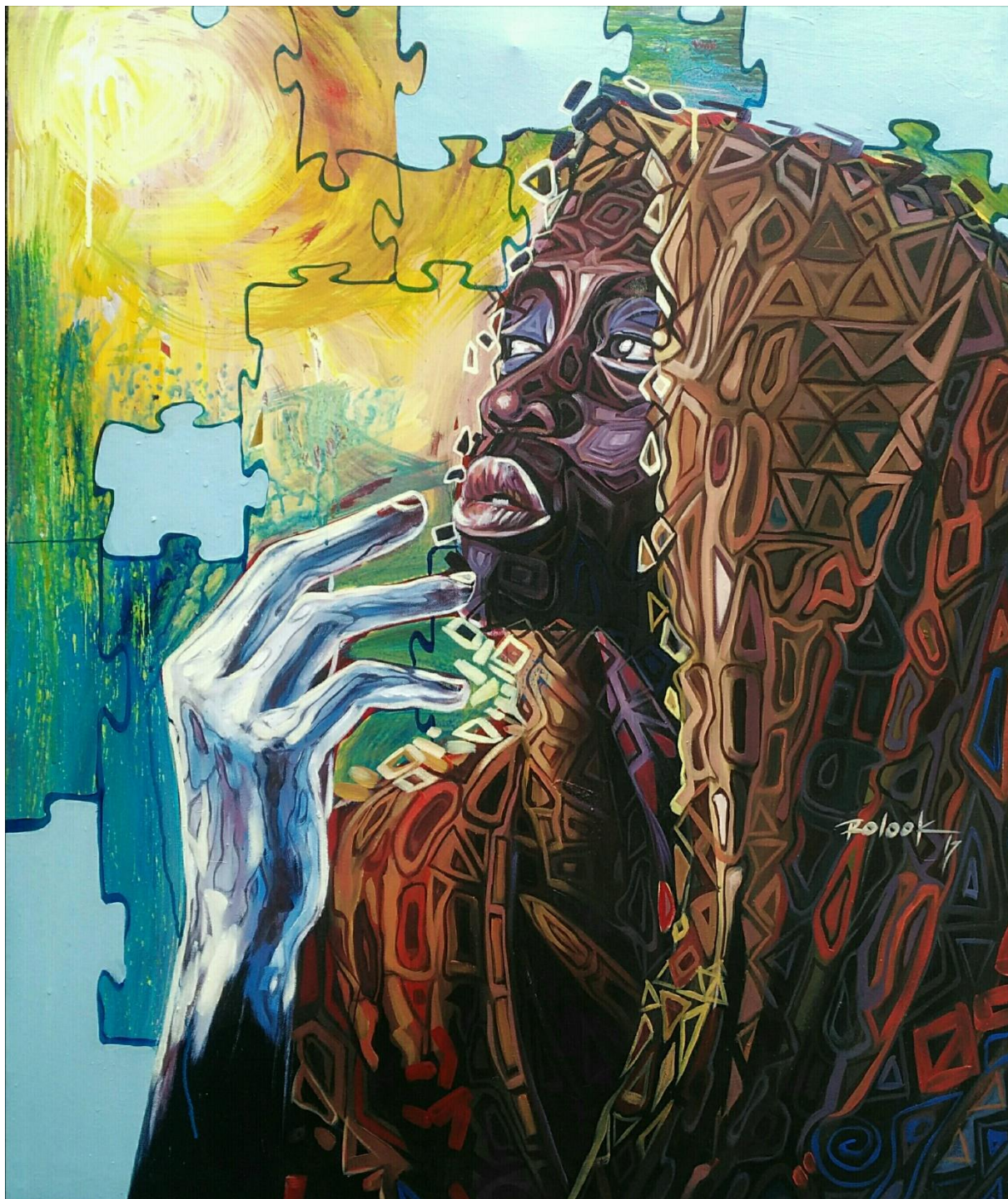
Le regard 90X120cm Technique mixte 2017