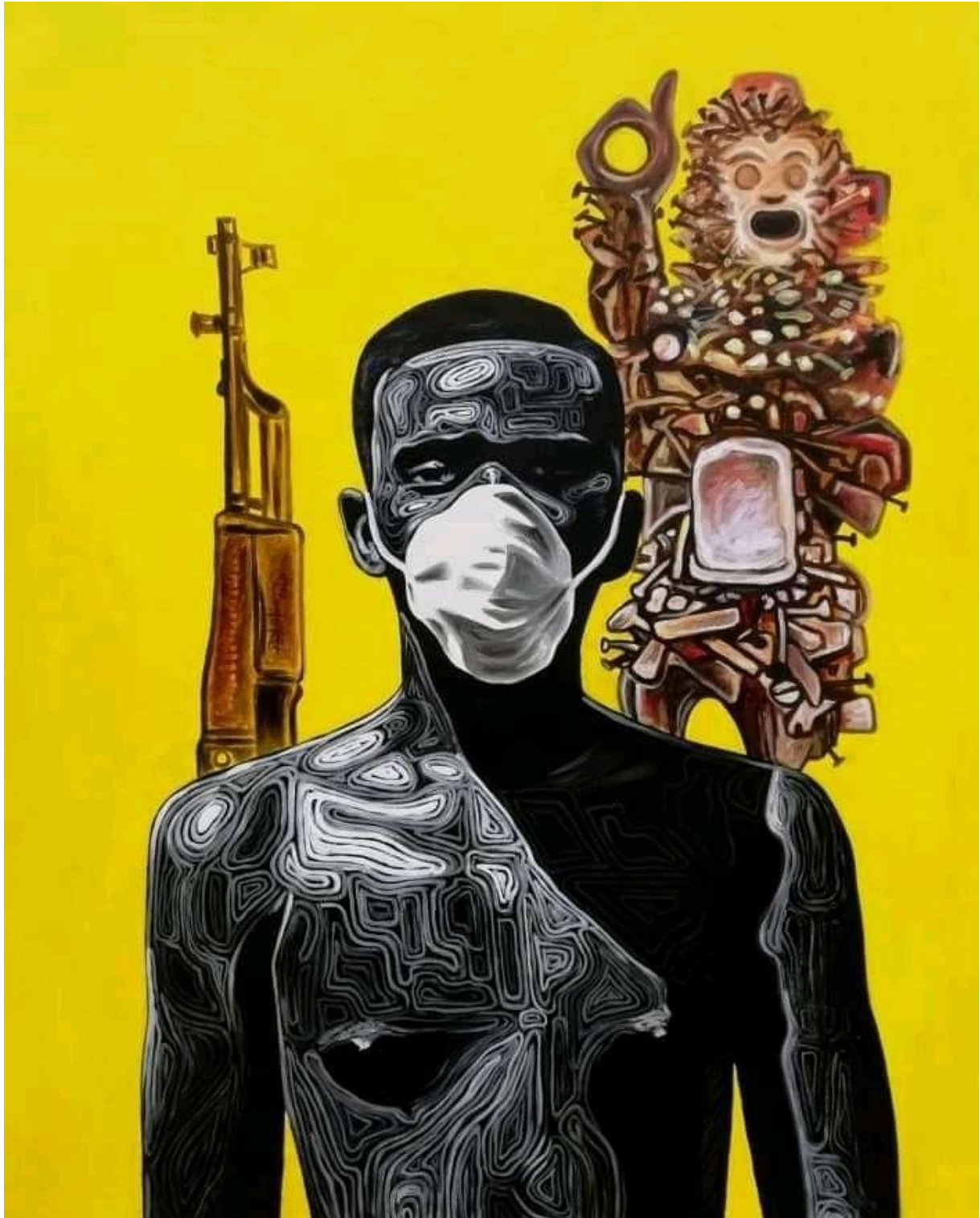
Victime Covid-19 120 X 90 cm Acrylique 2020

Art Beyond Quarantine: Victime Covid-19: Romario Rolook Lukau